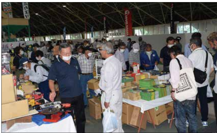
▲来場者で込み合う会場内。