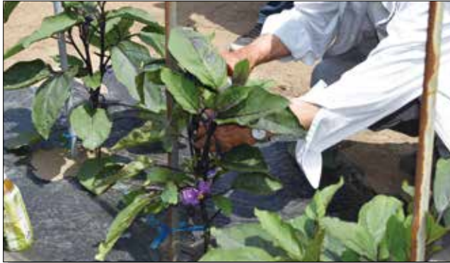
▲樹勢を見ながら、摘葉、摘芯を行います。