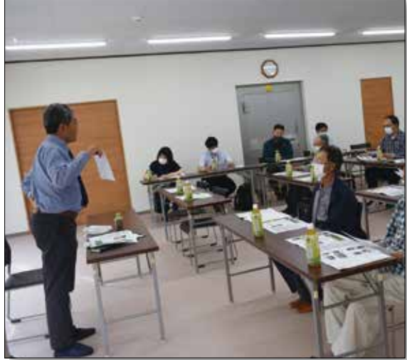
▲栽培の注意点を教わる生産者。

カネコ種苗野口部長より降霜時期から逆算した播種時期や摘芯、着果節位等の【ほろほろ】の通常栽培(夏)とは異なるポイントを説明頂きました。その後、飯田川・井川・五城目地区圃場で巡視会を行いました。現在の生育については生産者毎にばらつきはあるものの一番果着果時期となっており、収穫については7月末頃から開始され、風乾等を経て、出荷については8月上旬頃を見込んでおります。今後は梅雨時期、豪雨により発生が助長される【斑点細菌病、つる枯れ病】の適期薬剤散布や草勢維持管理を生産者に促し、高位安定生産に努めます。また、高単価が期待できる秋冬至向け栽培により生産者所得向上に努めて参ります。