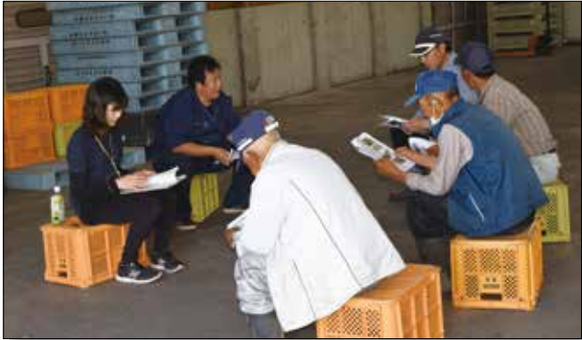
▲今後の栽培管理を確認する生産者。