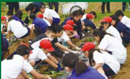
1 年生と 6 年生による苗植え。