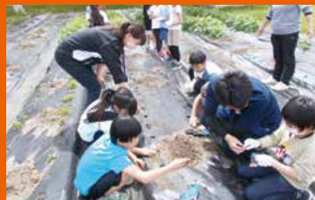
枝豆、大豆の播種作業を行う子どもたち。