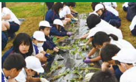
2 年生と 5 年生による苗植え。