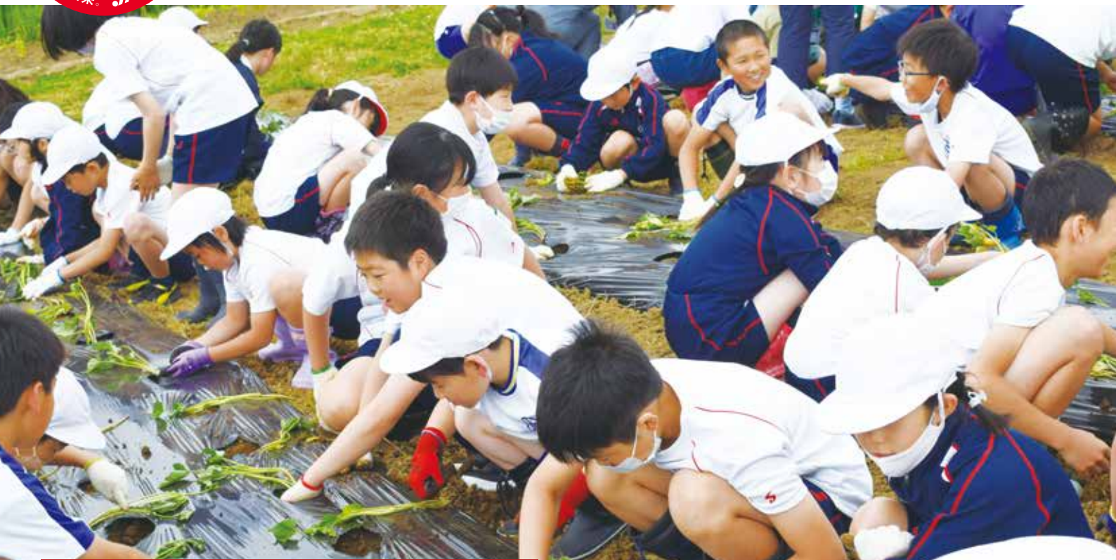
八郎潟小学校サツマイモ苗植え