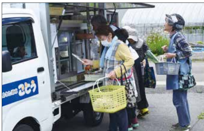
▲食材を選ぶ利用者様。

当JAは新しく移動購買車営業を開始し、1週間に月、水、金の3日間で近所に商店がない地域を重点的に巡回、買い物のため、なかなか出歩くことのできない利用者様を支援しています。販売している商品はパンや弁当、野菜等の豊富なラインナップを取り揃え、利用者様から「豊富な品揃えで、家の近くまで来てくれて助かります」と大人気です。今後も利用者様の暮らしに寄り添い、地域に根ざした事業を展開してまいります。