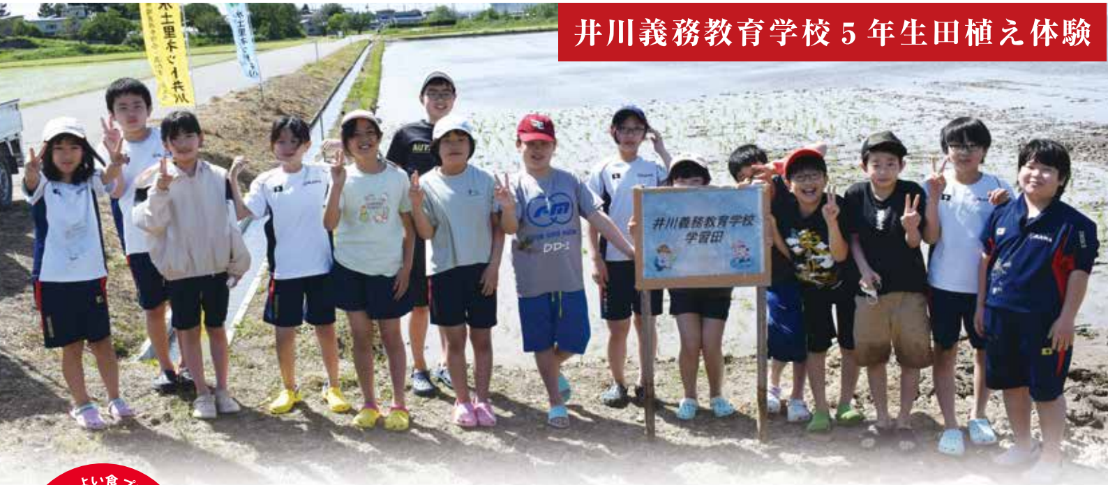
井川義務教育学校 5年生田植え体験