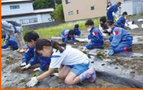
優しく丁寧に植えました。