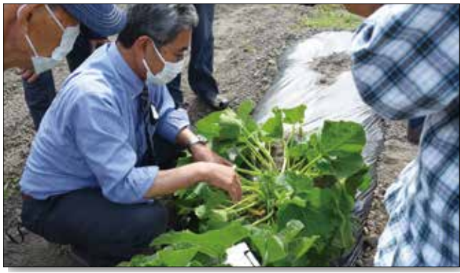
▲病害、着果状況を確認し、栽培管理を徹底しました。