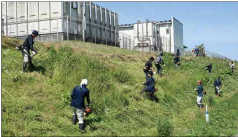
▲作業を行う JA 職員。

J A秋田厚生連「湖東厚生病院」においてJA職員が病院周辺の草刈り奉仕作業を行いました。草刈り奉仕作業はJAと病院の連携強化を目的として景観向上のほか、清潔感の維持などに貢献するため職員総出で行い、隔々まで刈り取りました。当JAはこれからも病院は地域のライフライン、地域の拠り所で、地域の皆さん、患者さんが気持ちよく過ごせる環境づくりのため、協力してまいります。