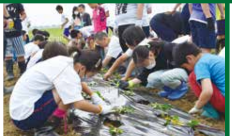
3 年生と 4 年生による苗植え。

八郎瀧小学校全校生徒がサツマイモの苗植えを行い、JA 営農指導員からは、植付け後に土をかける時は優しく布団をかけるように土をかけるよう呼びかけました。子どもたちは初めての苗植えで解からないことは上級生がサポートしながら、みんなで協力し植付けました。苗の植付け後、子どもたちからは収穫期にはたくさん収穫できるよう、今後は水やりや草取りしながら、大切に育てよう話がありました。