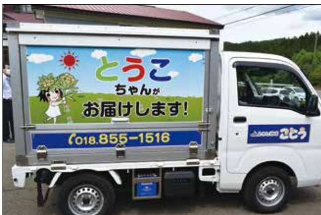
▲皆様、是非お声掛けください。