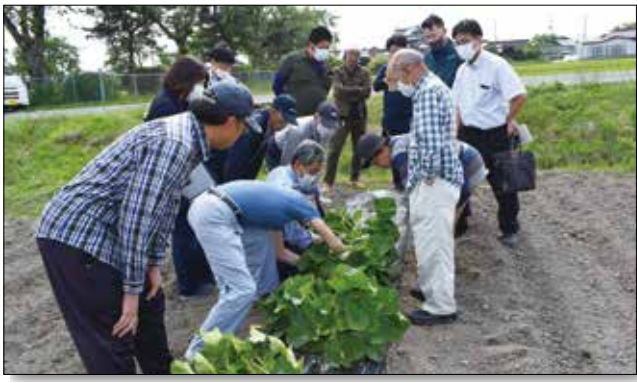
▲生育状況を確認する生産者。