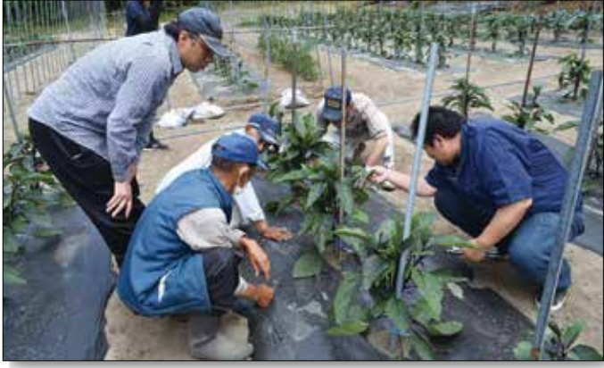
▲摘葉を行う生産者。

管内小ナス圃場巡回を行い、生育状況や生理障害、病害虫の発生状況について確認し、収穫に向けて栽培管理を徹底しました。また、地域振興局担当者から生産者へ今後の管理として、ナスは光を多く必要とするので新芽の生長、花の発育、果実の着色等に重要な役割を果たしているため、摘葉や整枝作業等呼びかけました。今後も圃場巡回を行い、生育状況を確認し、安定的な集荷に取り組みます。