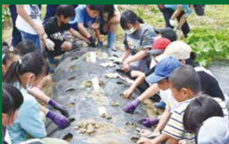
枝豆の播種作業を行う子どもたち。