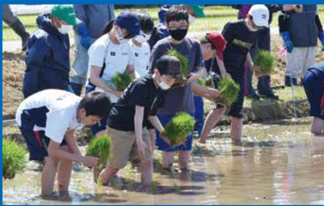
田植え作業を行う子どもたち。

井川義務教育学校5年生が地元農家の皆様のご指導のもと、学習田の田植え作業を体験しました。子どもたちのほとんどが初体験となる田植え作業で、作業を終えた子どもたちからは「泥で思うように動けず植えるのが大変でしたが、地域の皆様から丁寧に教えてもらい、みんなで協力しながら植えることができました。この後、順調に育ち、秋には豊作になることを期待しています」と話してくれ、教えてくださった皆様に感謝を伝えました。