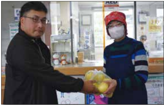
▲リンゴを提供する青年部。