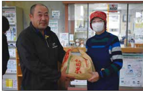
▲湖東産米を提供する青年部(写真左)。