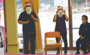
サンタクロースに扮した職員がクリスマス会を進行！