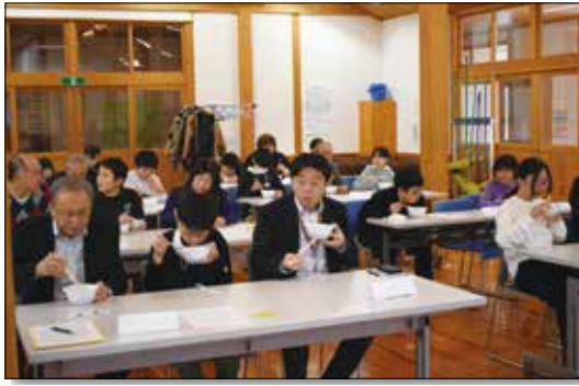
▲みんなで一緒にだまこ鍋を食べました。

井川義務教育学校にて収穫感謝祭を行いました。学習発表として5年生が現代農業を取り巻く情勢、農家の担い手不足、お米の消費拡大の取り組み等を発表しました。学習発表の後に収穫したお米を使用しただまこ鍋をいただき、みんなで収穫の喜びを分かち合いました。子どもたちは「農作業は初めてでしたが、教えてくださった地域の皆さまのおかげで、美味しいお米を収穫することが出来、農業に興味が増えました。自分たちが育てたお米が美味しいと言っていただけける事に農業のやりがいを感じました」と話してくれました。