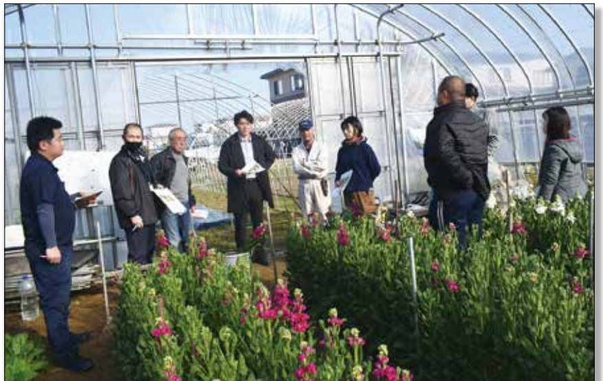
▲生育状況を確認する生産者。

ストック目揃い会を行い、年度末出荷に向けてのこれまでの気象経過等を元に今後の栽培管理を確認しました。目揃い会では秋田県産花き販売出荷動向、県内の市場情勢等について話し合い、秋田地域振興局の担当者からは開花促進として、低温要求性と長日開花性の要素が必要で、品種の早晩性によって低温の度合いが違うので、開花時期が遅れる場合は植調剤を使用する等呼びかけました。また、実際に収穫したストックを出荷規格表をもとに等級「秀品」「良品」に分け、今後の管理として、早朝にハウスを開けて、日中は換気をする事のほか、循環扇を活用して通風を図ること等を徹底しました。