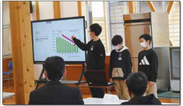
▲日本の農業について調査結果を話す子どもたち。