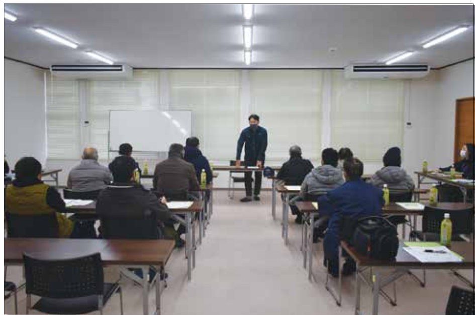
▲次年度の栽培について確認する生産者。