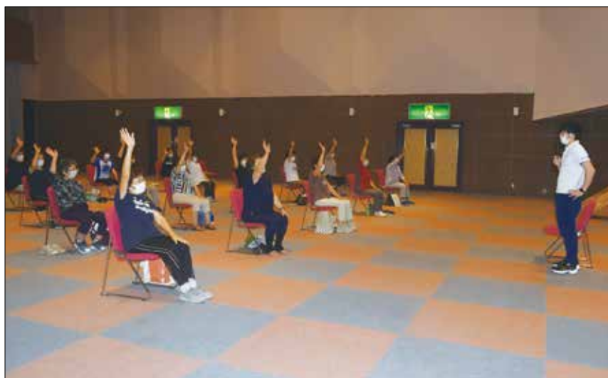
▲健康運動指導士の声に合わせて体を動かす女性部の皆様。