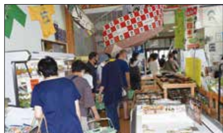
▲レジに並ぶお客様。