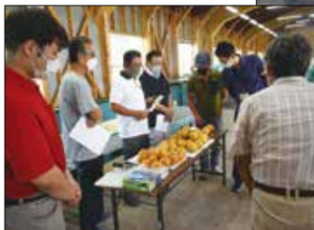
豊水着色基準査定会

昭和選果場にて、令和4年度幸水、豊水出荷説明会及び着色基準査定会を開催し、主産地の出荷等の情勢や現在の市場情勢について確認や、機械選果日程、集荷、品質基準を話し合い、適切な出荷基準を元に出荷することを徹底しました。また、着色基準査定会では実際に収穫された梨を手に取り、糖度や着色度合、玉揃いなどを確認しました。生産者は「美味しい湖東産の梨を食べてもらうために良品質の梨の出荷に取り組めます」と話してくれました。当JAは湖東産の梨の安定出荷に向けて、生産者と連携を図りながら、生産に努めてまいります。