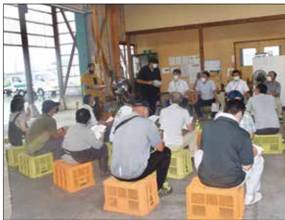
良品質な湖東の梨の出荷に取り組む生産者。