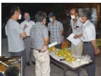
幸水着色基準査定会