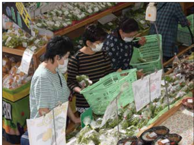
▲湖東の枝豆も大人気！