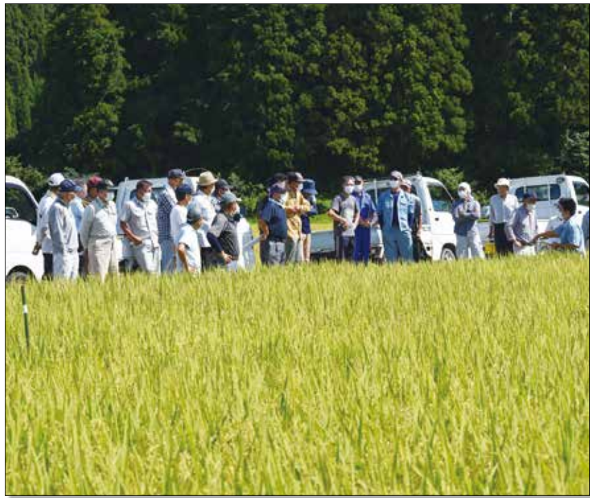
▲サキホコレの生育状況を視察する生産者。