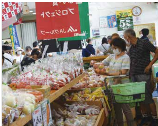
▲旬のリンゴを手にするお客様。

湖東のやさしい畑 彼岸フェア、秋の収穫感謝祭を開催し、秋の味覚が勢ぞろいしました。彼岸フェアは地場産野菜のほか、彼岸にお供えする桃、梨、リンゴなどを買求めるお客様で賑わい、秋の収穫感謝祭は地場産野菜のほか、湖東産の新米あきたこまちが並び、連日多くのお客様で賑わい、「旬の美味しい湖東産の野菜のほかに新米のあきたこまち、梨などの果物を買求めることができ、食べるのが楽しみです」と大満足でした。