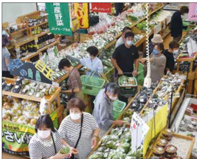
▲お客様で賑わう店内。