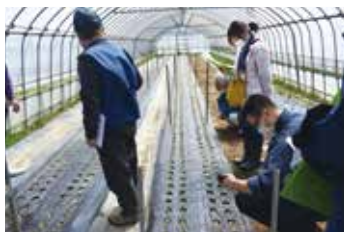
ハウス巡回1回目(4月)