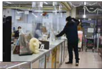
▶強盗が押し入っても冷静に行動しました。