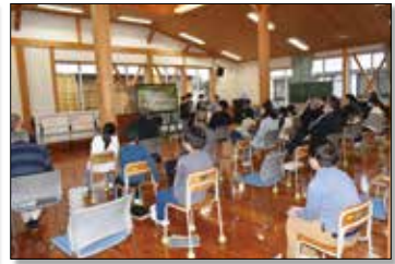
▲日本の農業について調査結果を話す子どもたち。