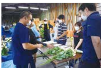
出荷規格目揃い会(7月)