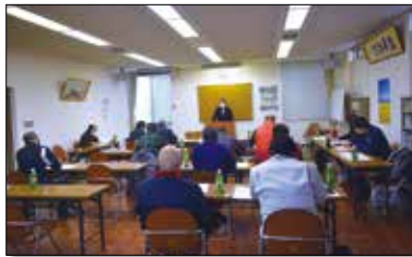
▲来年度も梨の安定出荷に向けて頑張ります。