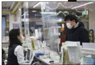
◀お金をどういった目的で使うのか職員がチェックしました。