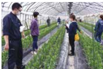
ハウス巡回2回目(6月)