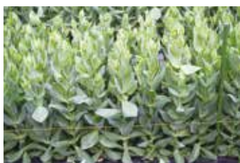
7月時点での生育状況、草丈が伸び、もうすぐ花が咲き始めます。