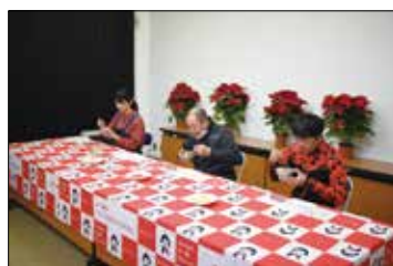
▲だまご鍋、湖東の漬物を試食しました。