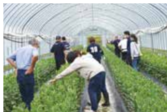
ハウス巡回3回目(7月)