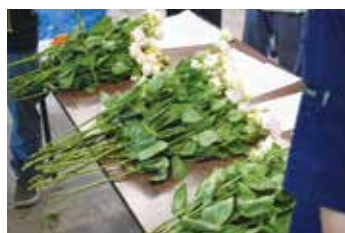
目揃い会では出荷基準を元に秀く良品に分けました。