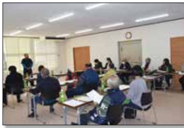
▲トルコギキョウの今年度の反省点と次年度への課題について話す生産者。

果樹実績検討会では、令和4年度果樹販売概況、販売実績、生育経過について確認しました。今年度の生育経過について、開花時期の大きな降霜被害はなく無事に着果し、順調に生育しました。来年度の生育対応として、今年度同様に的確な剪定など以上の管理を回り、生産量の拡大、安定出荷による強い産地を作るため、より一層、生産者、関係機関、JAが一体となり取り組んでまいります。また、第145回秋田県種苗交換会にて和梨部門で入賞となった3名の生産者様に