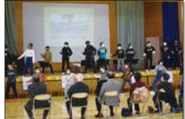
▲5年生全員で踊りを披露しました。