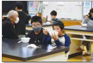
▲美味しいだまご鍋をみんなでいただきました。