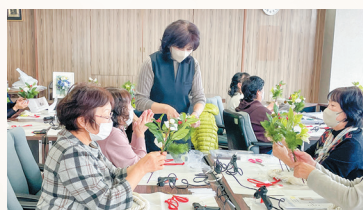
▲オリジナルの壁掛けを制作しました。

お正月の壁掛けアレンジ講習会(アーティフィシャルフラワー)を開催しました。参加者はお正月用の造花を使って華やかな壁掛けを制作しました。壁掛けは参加者同士で共有し、オリジナルティが溢れた素敵な作品に仕上がりました。