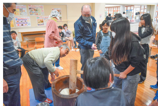
▲全校児童が餅つきを楽しみました。