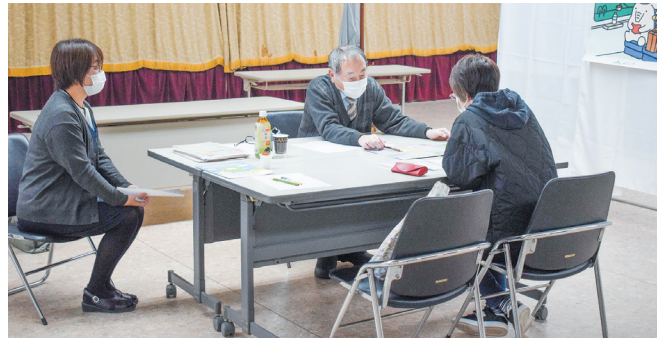
▲専門家が個人に合ったライフプランをアドバイスしました。