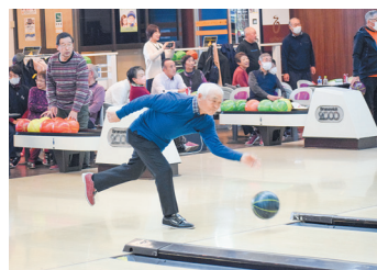
▲連続ストライクを目指しました。