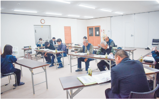
▲来年度の栽培に向け、重点事項を確認する生産者。

よりそいプラザ飯田川にて、令和7年度トルコギキョウ実績検討会及び品種選定会を開催しました。実績検討会では令和7年度トルコギキョウの生育状況、県内産の販売実績及び販売情勢等について協議しました。地域振興局の担当者からは、今年度の生育状況と今後の対策について説明がありました。生育過程において、重要なのが水管理となっており、高温時は少量多かん水として乾かさない工夫を行う事が説明されました。今後も病害虫防除や連作障害対策等の励行で高品質な生産に努める事を徹底しました。