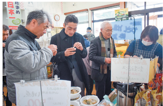
▲視察をするアグレンジャーの皆様。