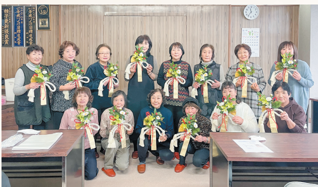
▲完成した壁掛けを披露する参加者。