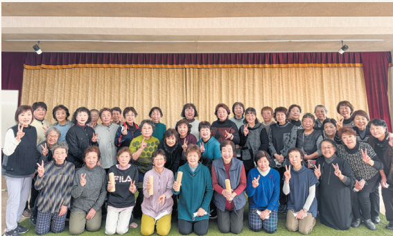
▲一緒にプレーした仲間たちと記念撮影をしました。

第14期JA湖東女性大学は第3講座「モルック」を楽しみました。参加者39名が6グループに分かれ、得点を競い合い、初めて行う競技を存分に楽しめました。