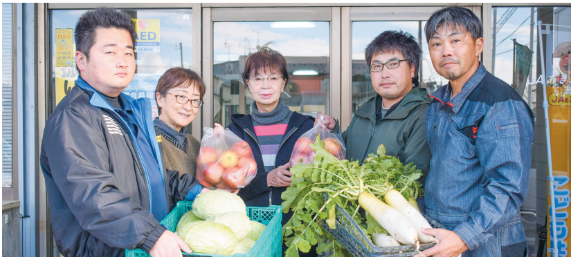
▲青年部が食材提供しました。

J Aあきた湖東青年部が県青協70周年記念事業として、「あつまれ！湯っ子食堂」へ「りんご」、「大根」、「キャベツ」を提供しました。子ども食堂は青年部から提供していただいた食材で地域の皆様がアイデアあふれる料理を創作し、子どもたちから大人気です。