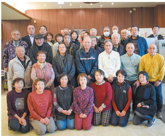
▲参加した会員で記念撮影をしました。

能代スポーツセンターにて第10回J Aあきた湖東年金友の会ボウリング大会を開催しました。ボウリング大会はコロナ禍による影響で、6年ぶりに開催し、年金友の会会員33名が仲間たちとボウリングを楽しみました。年金友の会は春から秋にかけてグラウンド・ゴルフを行い、冬の期間は室内で行う競技として、ボウリング大会を開催してまいります。会場ではストライクが連発し、ベスコアの更新に盛り上がりました。