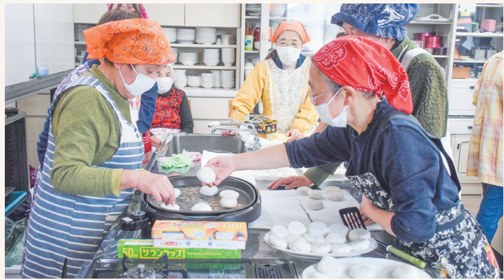
▲ふっくら美味しいおやきに仕上がりました。