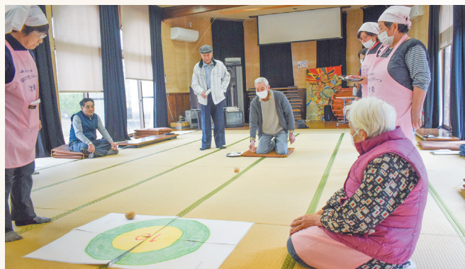
▲じゃがいもゲームで高得点を目指しました。

12月7日(日) JAあきた湖東助け合いグループ「太陽」、天神下お達者クラブの会員がレクリエーションを楽しみました。参加者は「脳トレ体操」、「じゃがいもゲーム」等で脳と身体を活性化させ、歌謡曲「上を向いて歩こう」をみんなで合唱し、仲間たちと楽しいひと時を過ごしました。