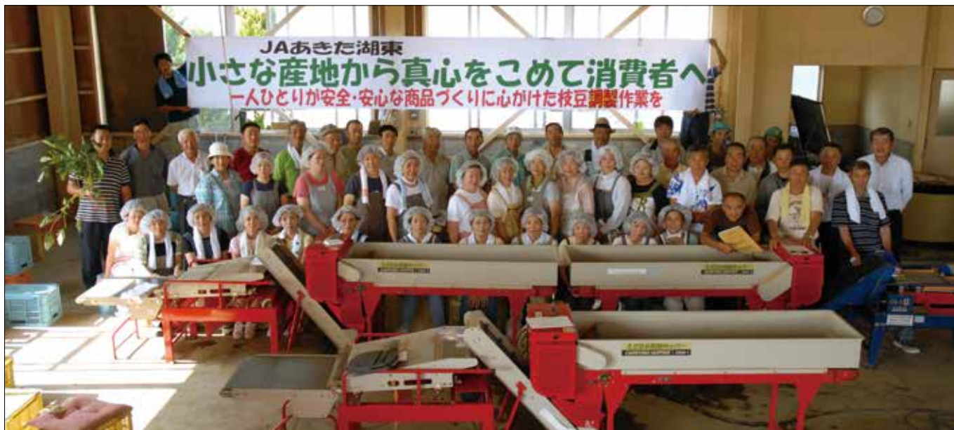
▲～小さな産地から真心をこめて消費者へ～(平成20年度の写真)