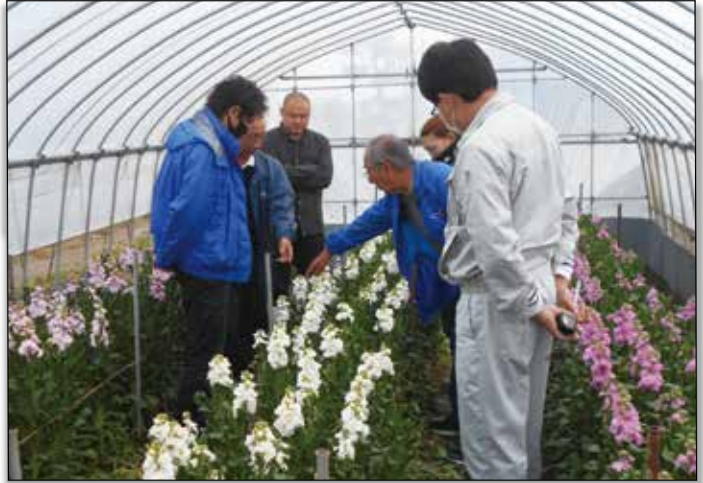
▲ストックの開花を確認する生産者。