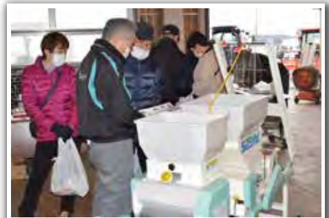
春作業に必要な商品を隈なくチェック!