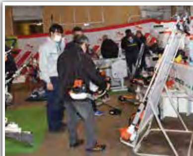
実際に手に取り作業のイメージをしました。