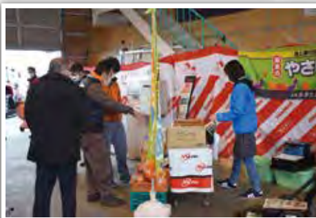
湖東のやさい畑の商品も大人気!!