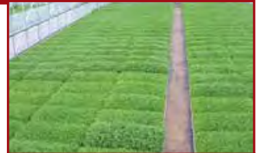
晴天時は、異常高温になるので換気する！ (新ビニールは注意)