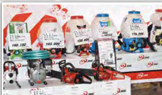
会場には様々なメーカーの動噴機等が立ち並びました。