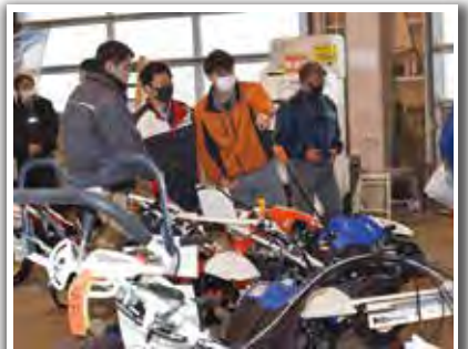
担当職員も大忙しです!