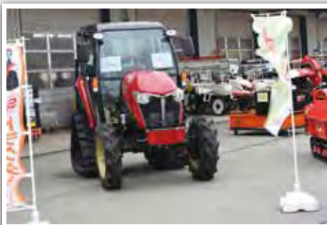
農業に欠かせないトラクターも展示されました。