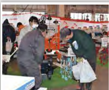
畔刈機での手入れ方法を教わる来場者。